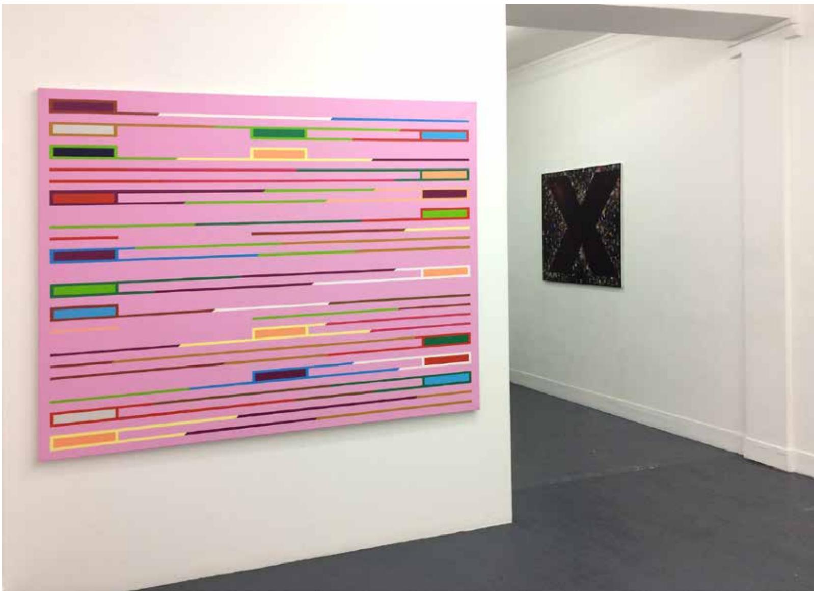
Vue d'exposition «Jamais seules ...» Ivan FAYARD Galerie Houg - Paris 2017