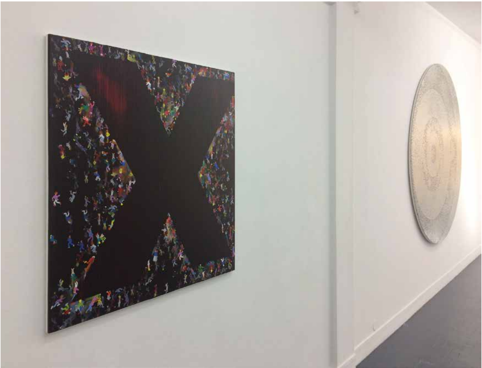
Vue d'exposition «Jamais seules ...» Ivan FAYARD Galerie Houg - Paris 2017