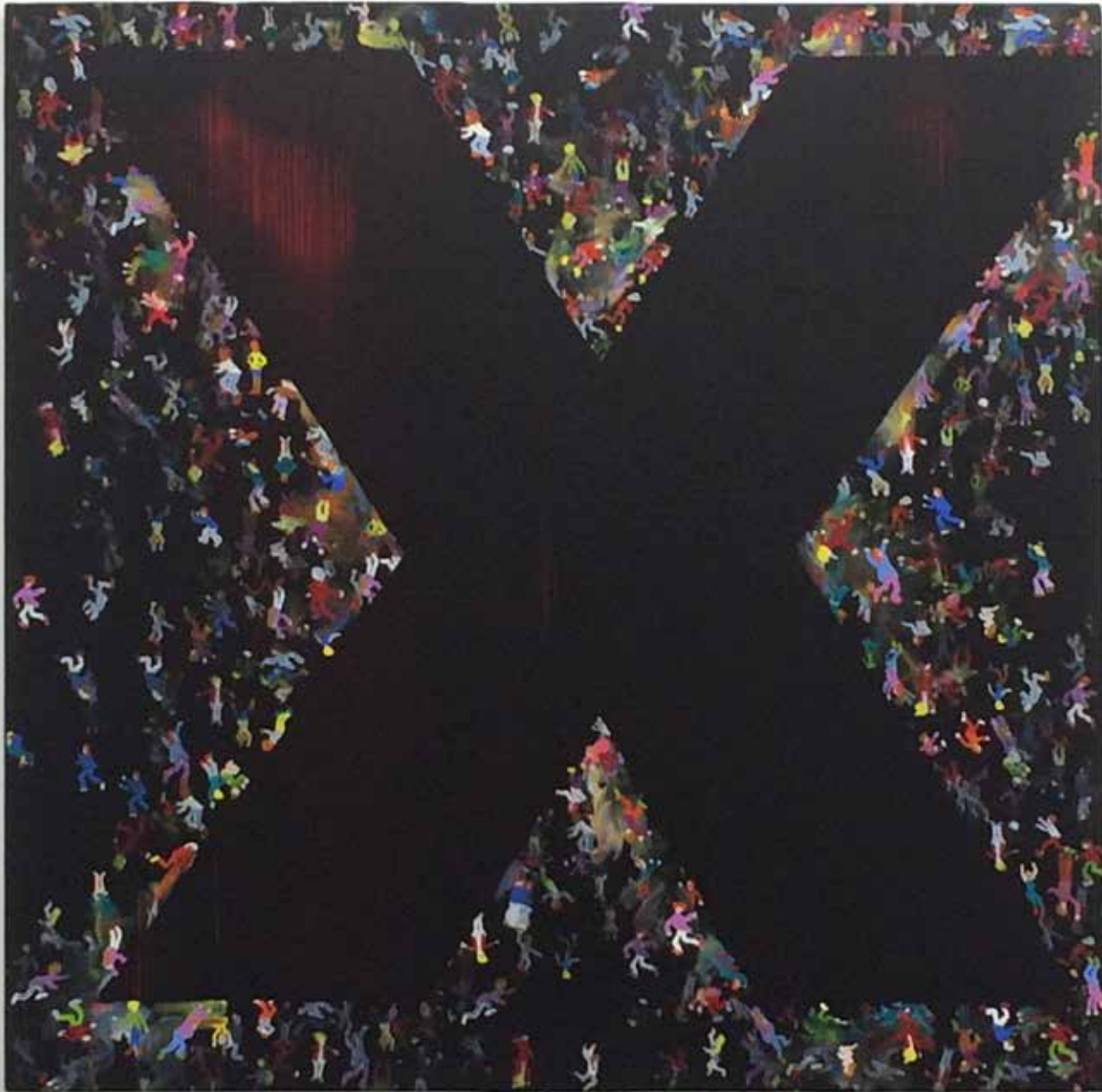
Ivan FAYARD X - 2017

Acrylique & huile sur toile 100 x 100 cm