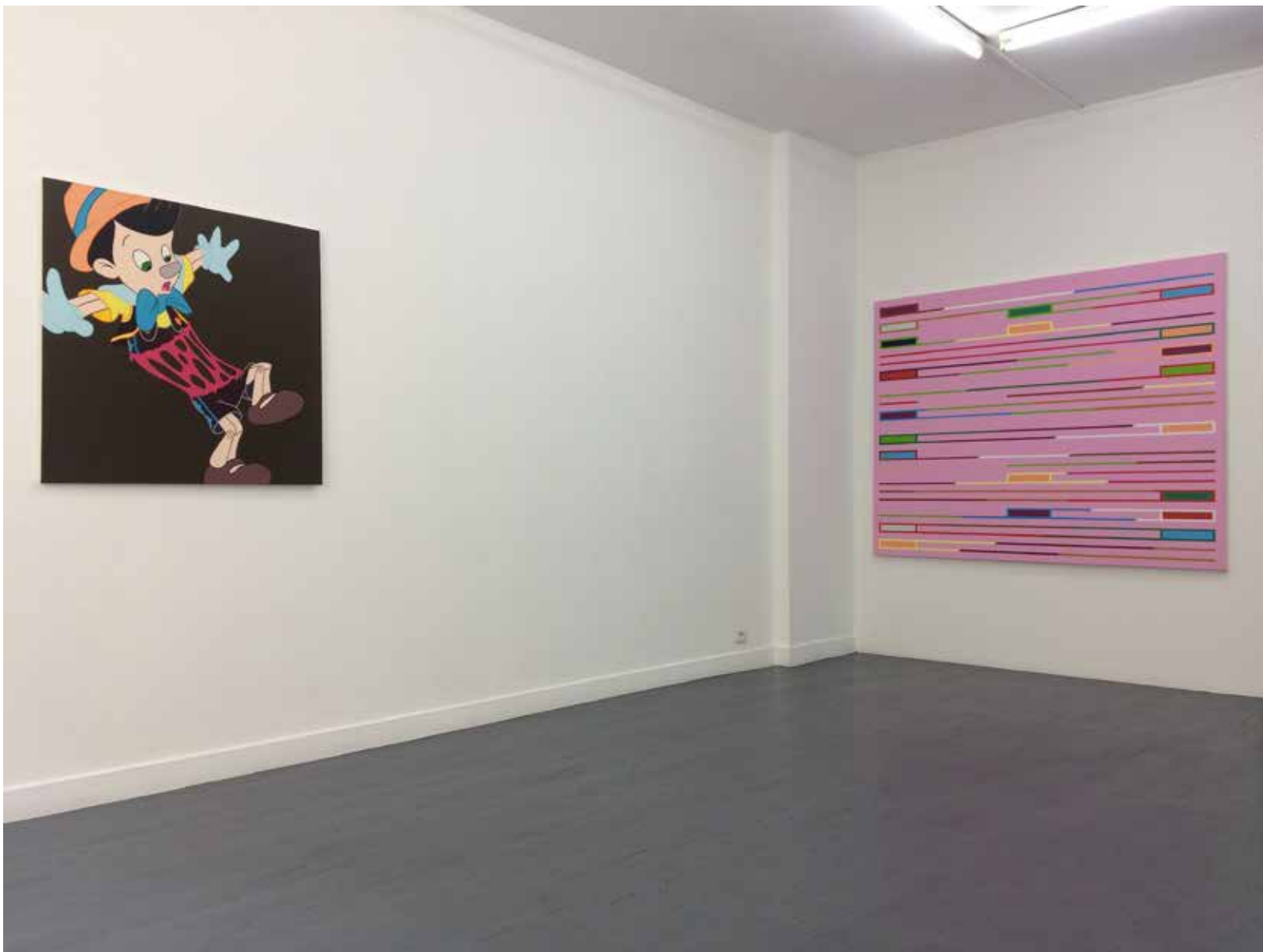
Vue d'exposition «Jamais seules ...» Ivan FAYARD Galerie Houg - Paris 2017