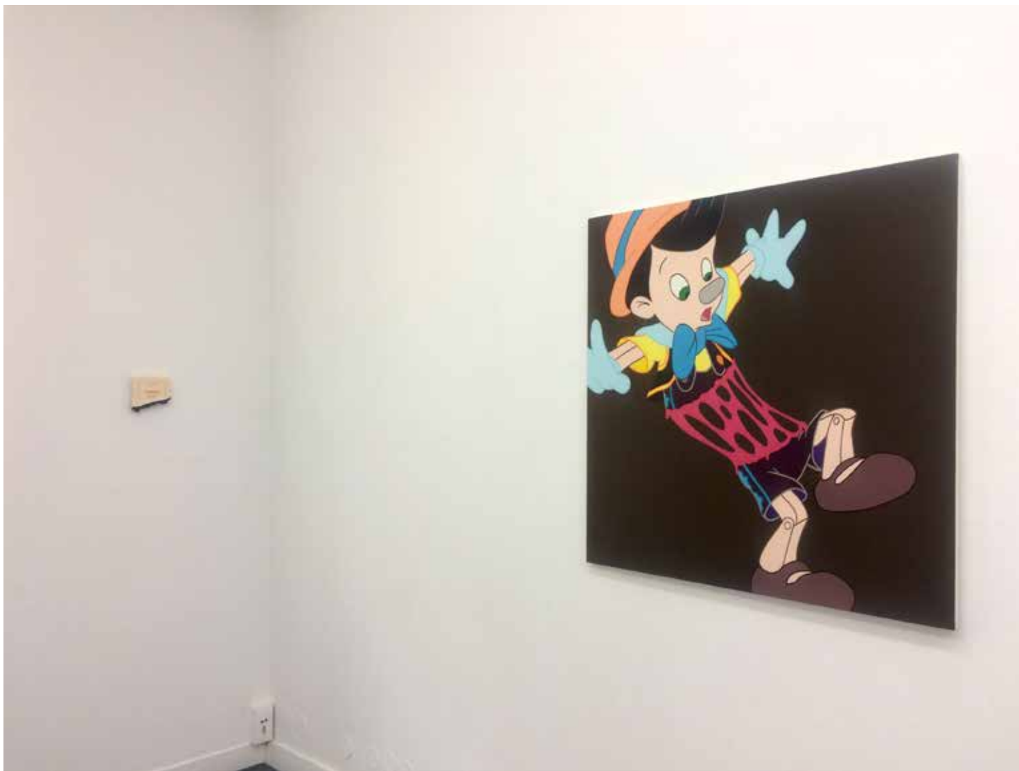
Vue d'exposition «Jamais seules ...» Ivan FAYARD Galerie Houg - Paris 2017