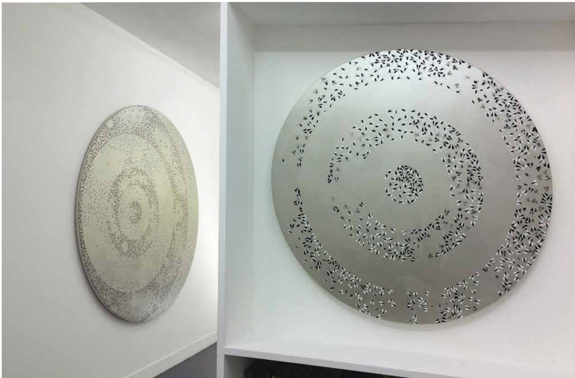
Vue d'exposition «Jamais seules ...» Ivan FAYARD Galerie Houg - Paris 2017